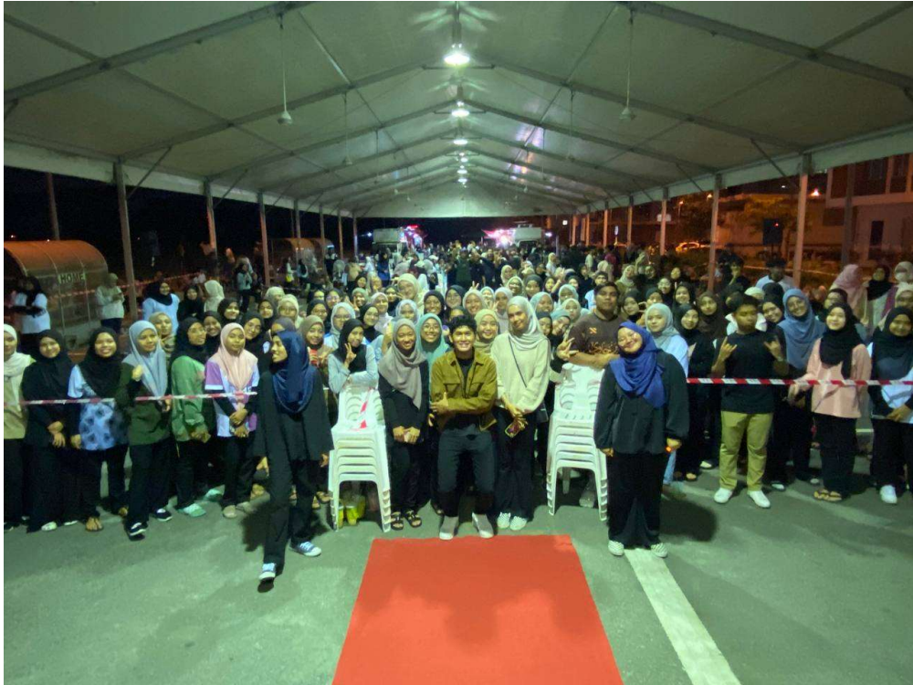
FIESTA UITM S3