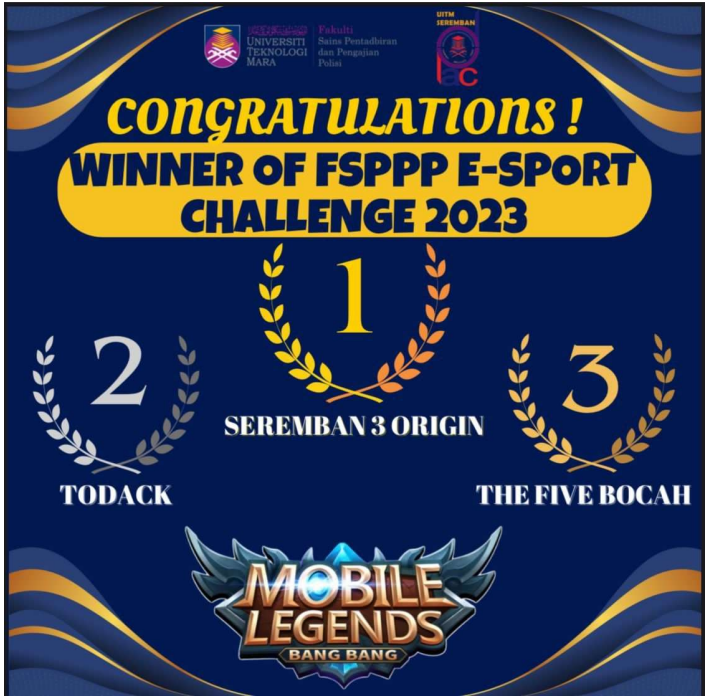
E-SPORT CHALLENGE FSPPP