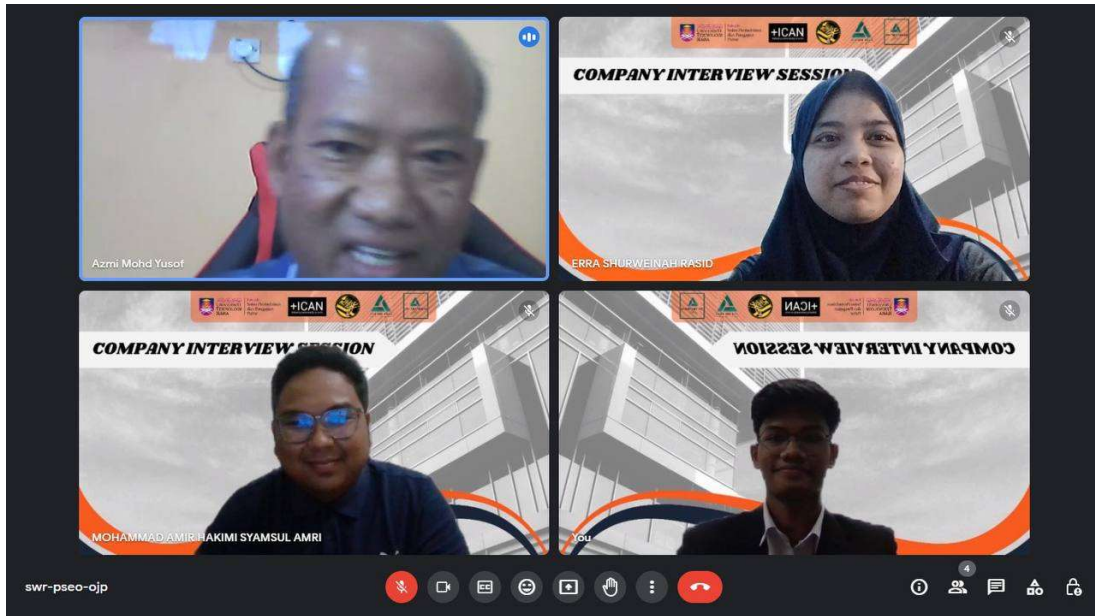
ASCAR CAREER: COMPANY INTERVIEW SESSION