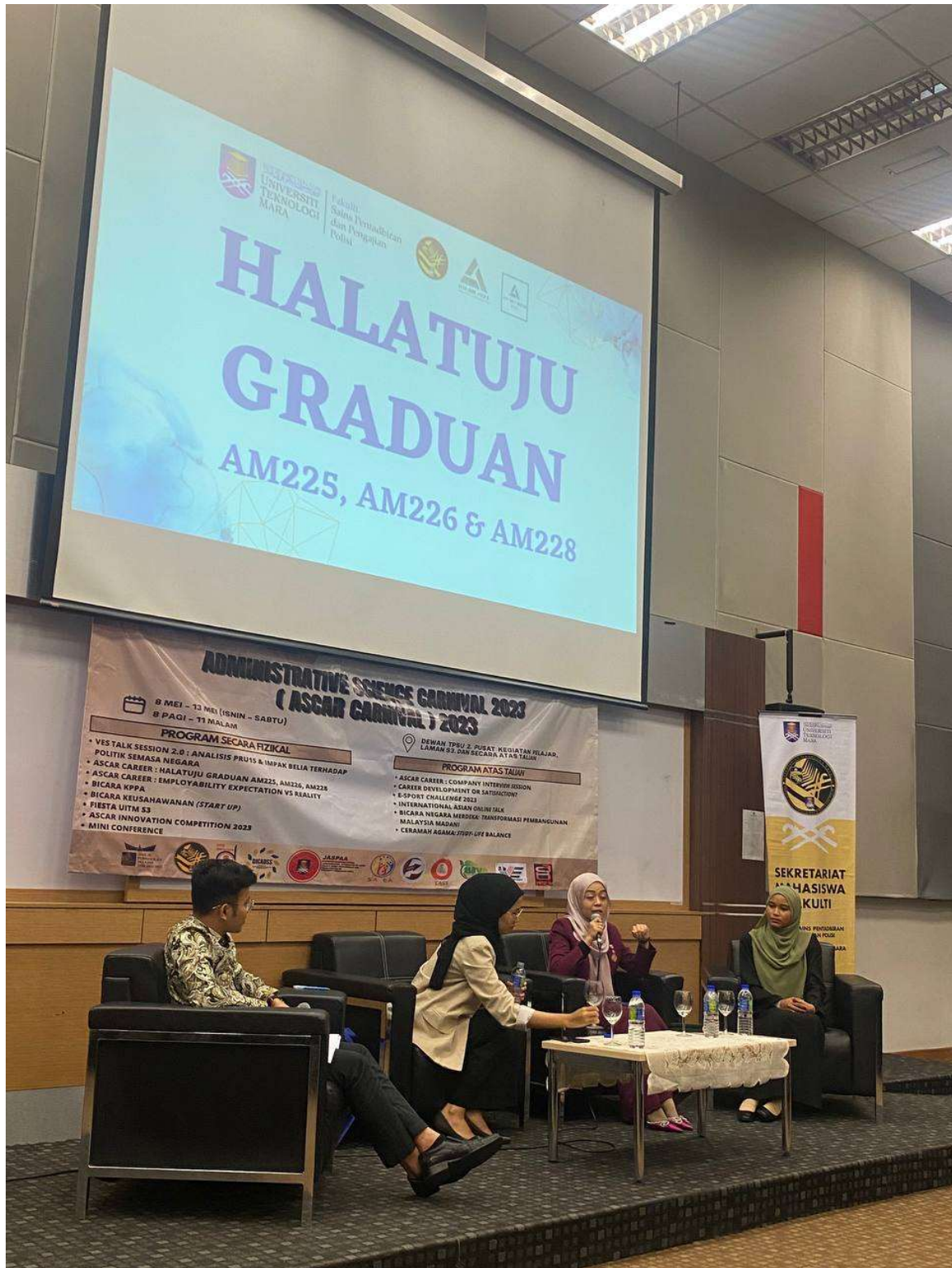
ASCAR CAREER: HALATUJU GRADUAN AM225, AM226 DAN AM228