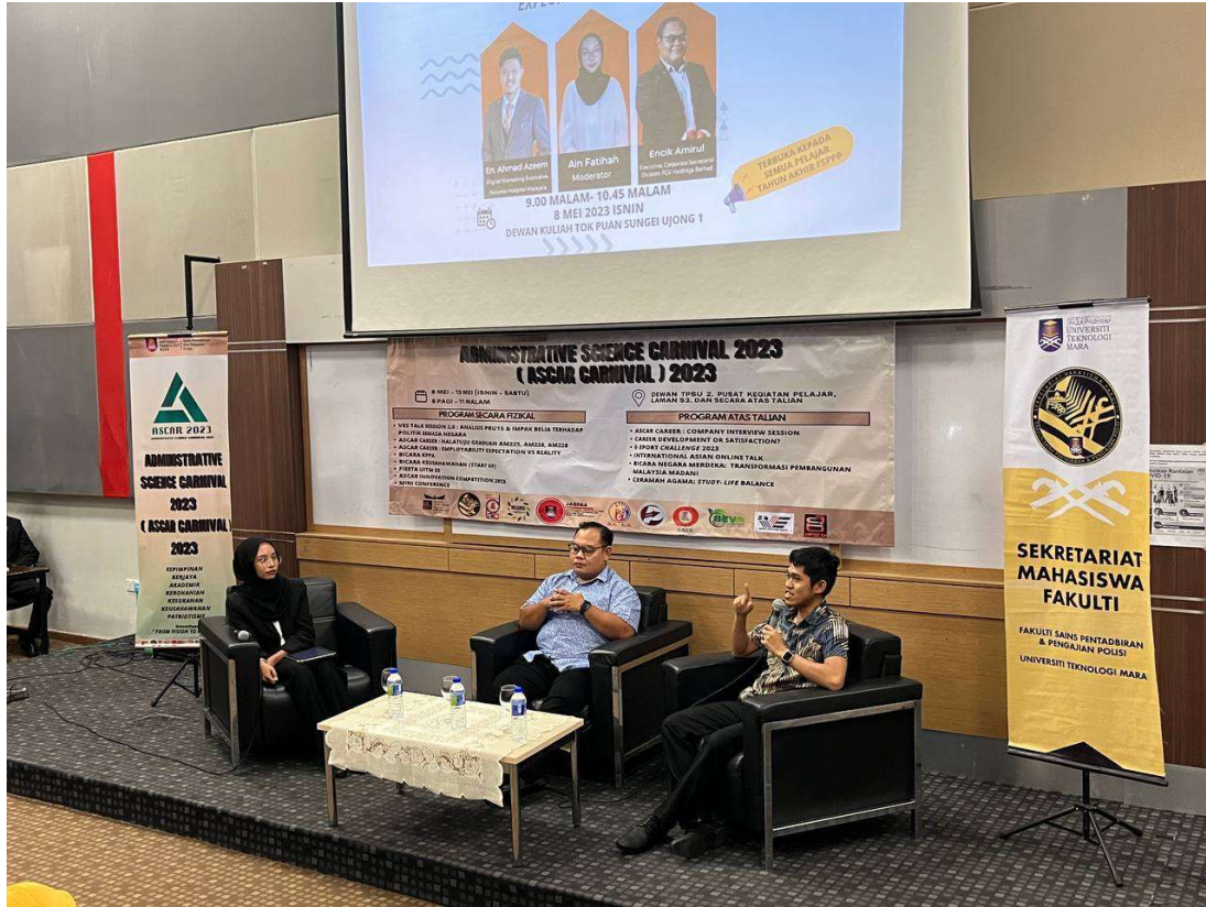
ASCAR CAREER: EMPLOYABILITY EXPECTATION VS REALITY