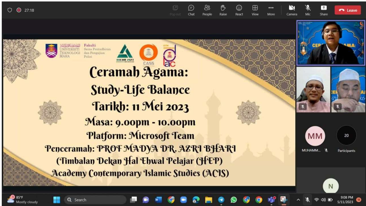
CERAMAH AGAMA: STUDY-LIFE BALANCE