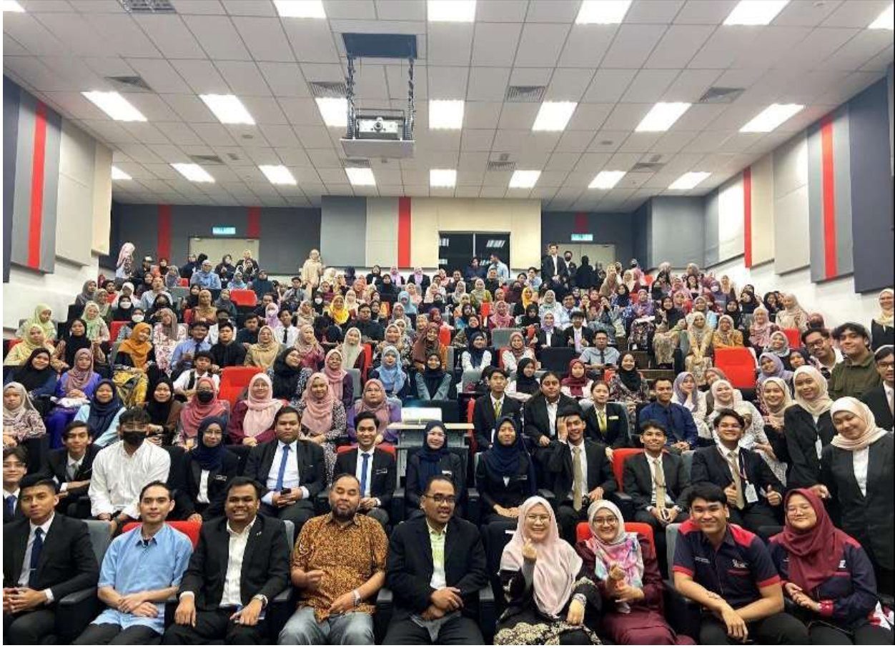
VES TALK SESSION 2.0: ANALISIS PRU 15 & IMPAK BELIA TERHADAP POLITI SEMASA NEGARA