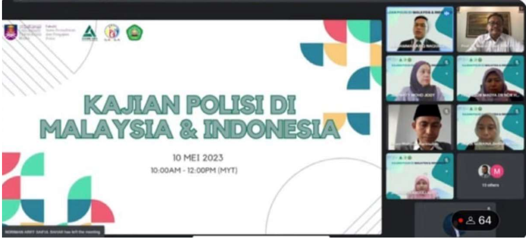
SASEA ONLINE TALK: KAJIAN POLISI DI MALAYSIA & INDONESIA